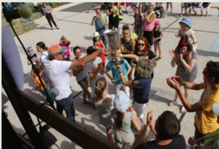
Pleum'en Fête 2017