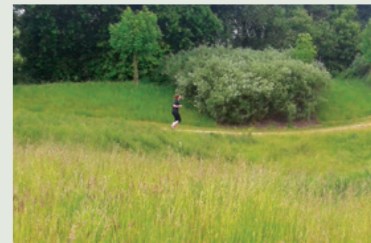
Un cadre de vie naturel à préserver

gestion différenciée en ayant le souci de sensibiliser la population à son intérêt : compostage collectif, jardinage sur l'espace public... Tendre vers un cadre de vie entre ville et campagne : c'est l'affaire de tous ! (voir page 5 et n°109 – avril 2017). ●