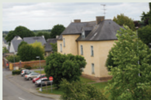
Restauration rue du Presbytère.

« Permettre le maintien de la population actuelle et l'accueil de nouveaux habitants par un niveau d'équipements et de services en adéquation avec les besoins présents et futurs pour le confort de tous au quotidien et par une solidarité qui favorise les échanges (services de proximité, tissu associatif, économie locale...) » tel est l'un des enjeux de notre projet politique dans le nouveau PLU (Plan Local d'Urbanisme) en vigueur depuis janvier 2017.