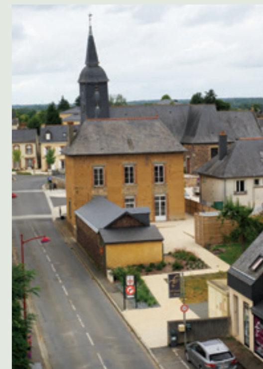
Aménagement piéton sécurisé, rue de Rennes.

gestion différenciée en ayant le souci de sensibiliser la population à son intérêt : compostage collectif, jardinage sur l'espace public... Tendre vers un cadre de vie entre ville et campagne : c'est l'affaire de tous ! (voir page 5 et n°109 – avril 2017). ●