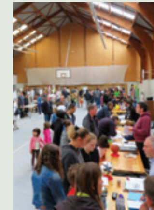
Forum des associations 2017 à la salle des sports.