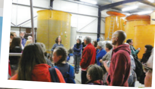
Visite de la cidrerie, suivie de la ville de Monfort.