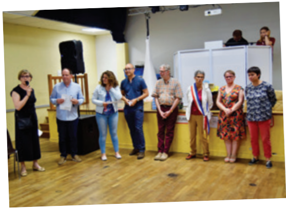
Discours officiel lors de la visite des Gallois le 1 er juin 2018.

Llanfairfechan : station balnéaire de 3 600 habitants à Conwy, Galles du Nord.