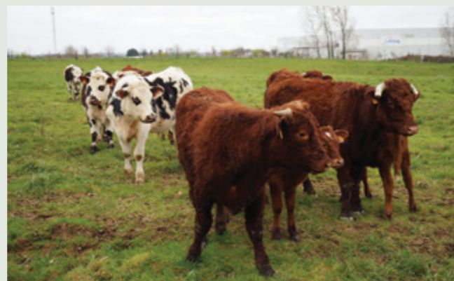
Vaches Salers et boeufs normands sur la prairie de Lauzenais.