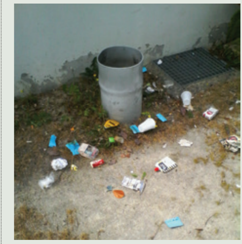
Ordures à côté d'une poubelle au groupe scolaire Le Petit Prince.

Retrouvez les informations sur vos déchets sur le site du SMICTOM : www.smictom-centreouest35.fr/que-deviennent-vos-dechets