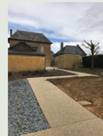
1, rue de Rennes dernier aménagement réalisé par les agents aux espaces verts.