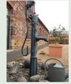
Pompe à eau à la médiathèque (petit patrimoine entretenu par le service technique).

Sur Pleumeleuc, la collecte des déchets ménagers et assimilés est gérée par le SMICTOM et celle des déchets urbains issus des espaces publics par la commune.