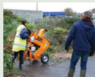
Mise à disposition du broyeur communautaire.

- soit en paillage sur le sol afin de protéger les plantes du froid, réduire les besoins en eau et limiter la pousse des plantes invasives, - soit en compostage constituant la matière sèche nécessaire au fonctionnement des composteurs mis en place sur la commune. Par exemple, depuis l'installation, en 2015, du composteur au restaurant scolaire, 10 à 15 kg de déchets par jour sont ainsi valorisés, le gaspillage limité... et les enfants sont sensibilisés et formés aux gestes éco-citoyens.